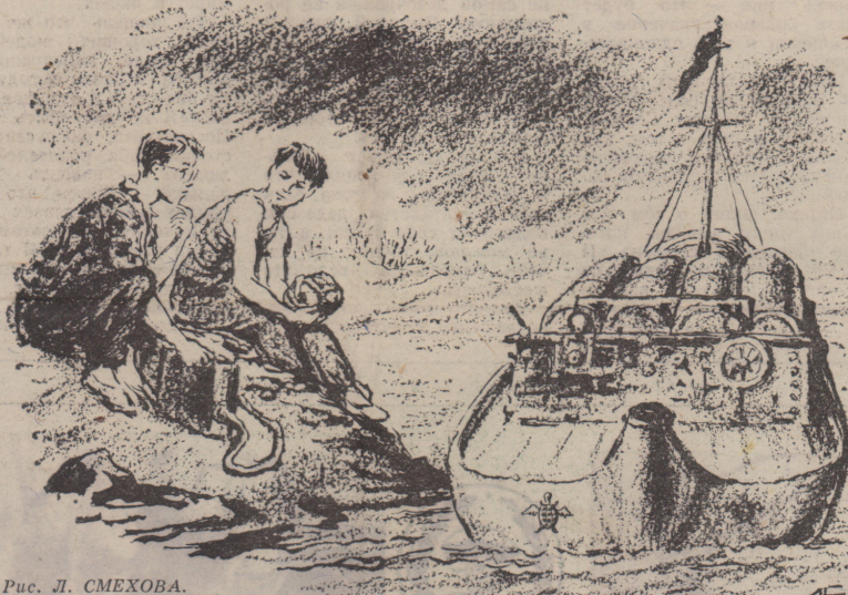
Рис. Л. СМЕХОВА.

было. До седьмого класса жизнь была удивительно проста, и дальнейшее тоже представлялось простым и очевидным: окончил школу, поступил в военно-морское училище. А пока я занимался в морском кружке Дома пионеров, читал книги о морских сражениях, бегал в яхт-клуб и при такой бурной деятельности умудрялся вётаки не получать двоек. Яшка учился на пятёрки, с ним тоже почти всё было ясно: он станет врачом, как его отец и дед. Мы жили в одном дворе, учились в одном классе и сидели за одной партой. Яшка был типичным «очкариком», но я считал, что, может быть, в конце концов из него получится морской врач.